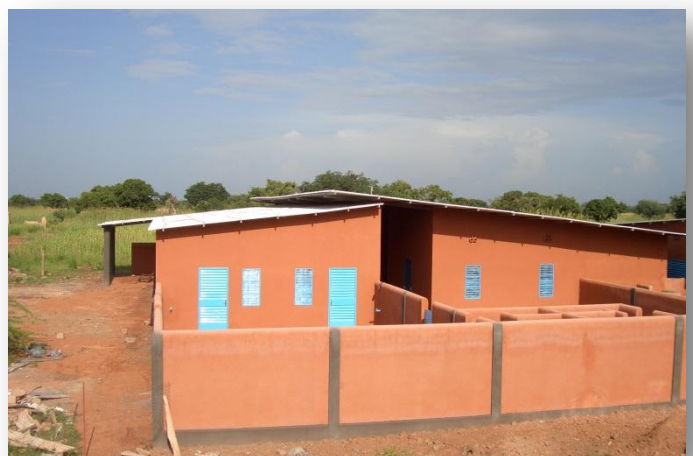
LE NOUVEAU MODULE

Depuis février 2011 la bibliothèque du foyer à connu un nouveau départ avec l'arrivée de Mlle Olympe Larue. Toutes les pensionnaires et aussi les filleules de Pogbi non pensionnaires qui fréquentent le collège de Dapelogo sont autorisées à emprunter les livres pour l'instant.