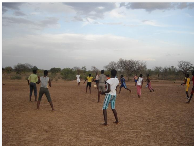
LES FILLES EN PLEINE ACTION!

Depuis quelques semaines nous enchaînons le sport avec les pensionnaires. Nous avons déjà organisé plusieurs ballades pour découvrir les alentours du foyer comme le barrage de Dapélogo ou la piste de Guiè. Le samedi 7 mai, nous avons organisé un match de football - Module 1 contre Module 2 – (les filles sont réparties par module au sein du foyer). Nous étions environ une vingtaine sur le terrain du CEG voisin. Le plaisir du jeu était au rendez-vous et la rencontre s'est terminée par un match nul grâce à un pénalty de dernière minute pour l'équipe du module 1. A la suite de ce match, les filles ont décidé de remettre en état le terrain de volley-ball qui est situé dans l'enceinte du foyer. Elles ont nettoyé le sol et remis en place le filet. Les matchs de volley-ball peuvent donc reprendre à Pogbi pour le plus grand plaisir des pensionnaires ! [Article écrit par Olympe Larue]