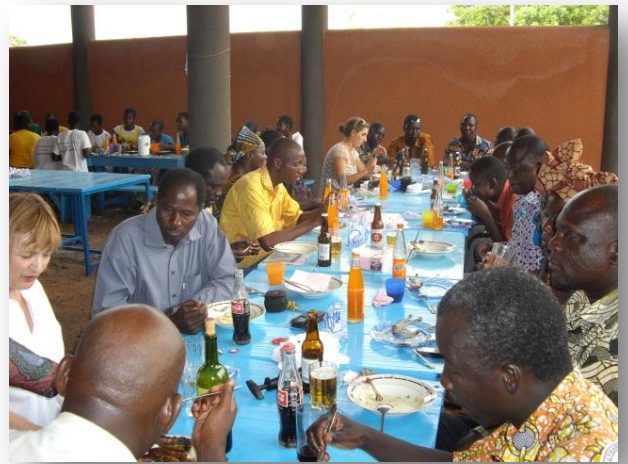
DE NOMBREUX INVITES ETAIENT PRESENTS

Une de nos pensionnaires a ouvert la cérémonie par un discours. Nous avons également assisté à une danse et une pièce de théâtre sur le mariage forcé montée par les filles est venue clôturer les animations. Peu après un repas a été servi à toutes nos pensionnaires et invités. Le soir, la cour du foyer s'est enflammée pour une nuit de musique et de de chant !