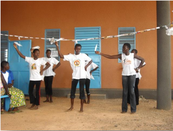
NOTRE TROUPE DE DANSE!

Une de nos pensionnaires a ouvert la cérémonie par un discours. Nous avons également assisté à une danse et une pièce de théâtre sur le mariage forcé montée par les filles est venue clôturer les animations. Peu après un repas a été servi à toutes nos pensionnaires et invités. Le soir, la cour du foyer s'est enflammée pour une nuit de musique et de de chant !