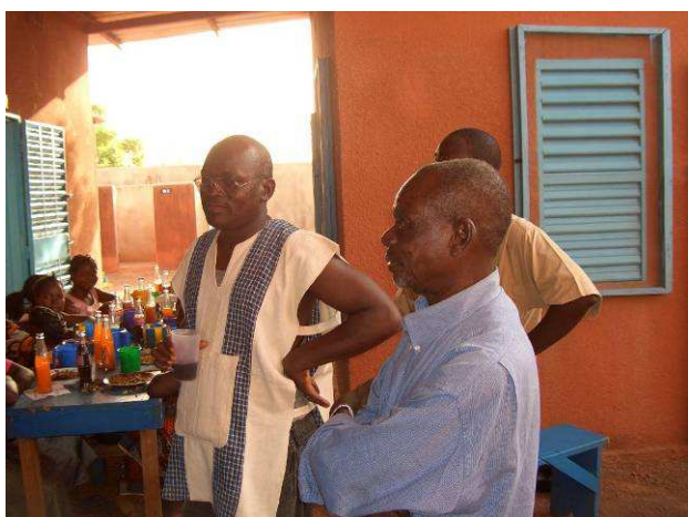
Le directeur du collège et le maire adjoint échantent sur l'enseignement au Burkina Faso