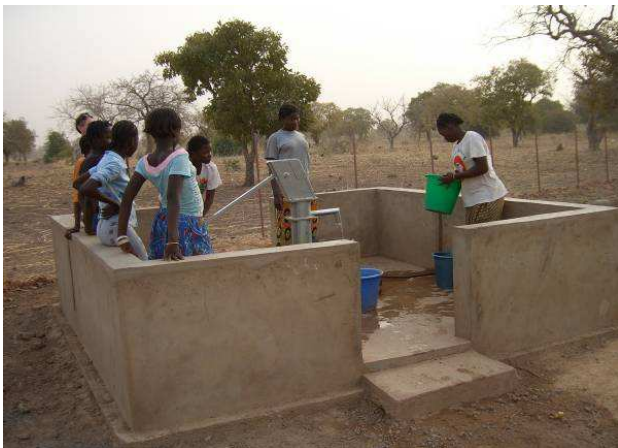
L'aménagement du puits du foyer