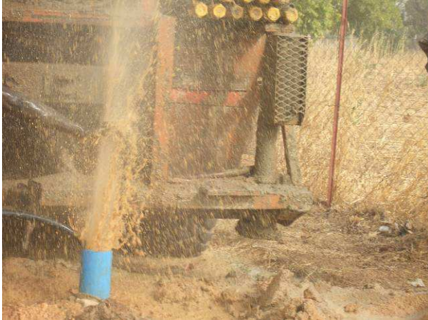
et l'eau jaillit !

Ce qui a procuré une grande joie à toutes les filles : finie la corvée d'eau, finie la longue queue au forage du collège, et autant de temps gagné pour les études.