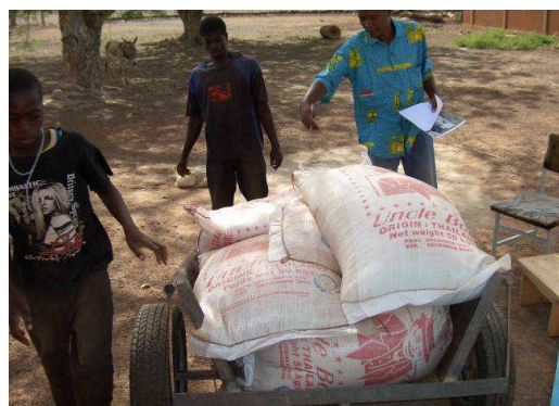
Le directeur de l'école de Zakouré