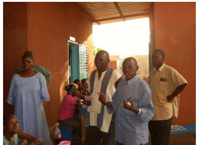
Le Maire adjoint prend la parole pour encourager les pensionnaires à redoubler d'efforts et surtout à être disciplinés.

Le maire adjoint a pris la parole pour remercier pour ce geste qui est venu au bon moment : « L'année est très dure, la famine est bien là et les enfants souffrent énormément. Nous les conseillers municipaux nous avons tenté de mettre en place une cantine endogène où chaque parent devait apporter du mil pour faire un repas chaque midi pour les enfants mais la participation a été très faible et seulement 30% des parents ont pu honorer leur engagement car tout simplement il n'y a rien dans les greniers et, comble de tout, l'inflation du prix des denrées fait rage. Par ma voix, tous les conseillers réitèrent leurs remerciements à l'association Pogbi pour ce geste ».