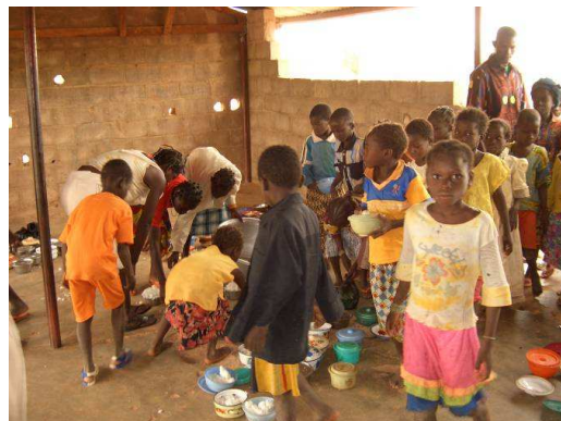
La cantine de l'école A de Dapelogo