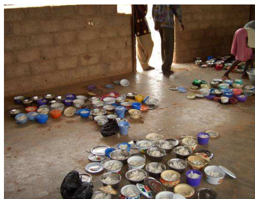
La cantine de l'école de Pamtanga

J'ai évité de faire beaucoup de photos pendant que les enfants mangent. Dans chaque école il y a plusieurs méthodes de partage. Les cantinières préparent mais pour le service ce sont les grandes filles de l'école qui servent le repas dans les gamelles. Dans d'autres écoles les enfants sont alignés et on les sert directement dans les gamelles. Il y en a d'autres aussi qui regroupent les gamelles par classe. J'ai passé beaucoup de temps avec les enfants. Dans chaque école je suis allé au moins 5 fois mais j'ai évité de faire beaucoup de photos. Vraiment une fois de plus merci à POGBI.